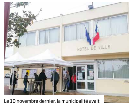
Le 10 novembre dernier, la municipalité avait déjà organisé une session de vaccination anti-grippe devant l'hôtel de ville.

Pour prendre rendez-vous pour un test antigénique COVID-19, renseignez-vous auprès des professionnels de santé de la ville.