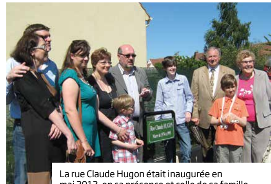
La rue Claude Hugon était inaugurée en mai 2012, en sa présence et celle de sa famille

ne puisse pas être réduite à une direction ou une adresse mais qu'elle soit force d'exemple et qu'elle nous rappelle au quotidien les exigences d'une vie engagée.