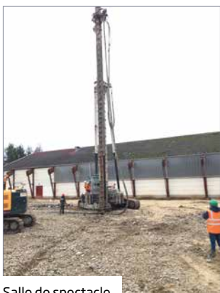
Salle de spectacle