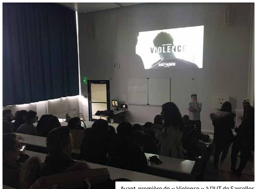
Avant-première de « Violence » à l'IUT de Sarcelles

Quel que soit le genre cinématographique choisi (thriller, autoportrait, drame, clip), toutes les productions